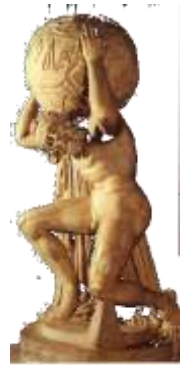
Atene Prometeu de Més amb els grecs. Músculo de gres.

Creació de l'home. Prometeu va crear els primers homes modelant-los amb argila, i Atena va bufar alè de vida sobre la imatge de fang. Però aquesta llegenda no surt a la Teogonia d'Hesíode, on Prometeu simplement és el benefactor de la humanitat, no el seu creador; si va enganyar Zeus va ser per amor als homes.